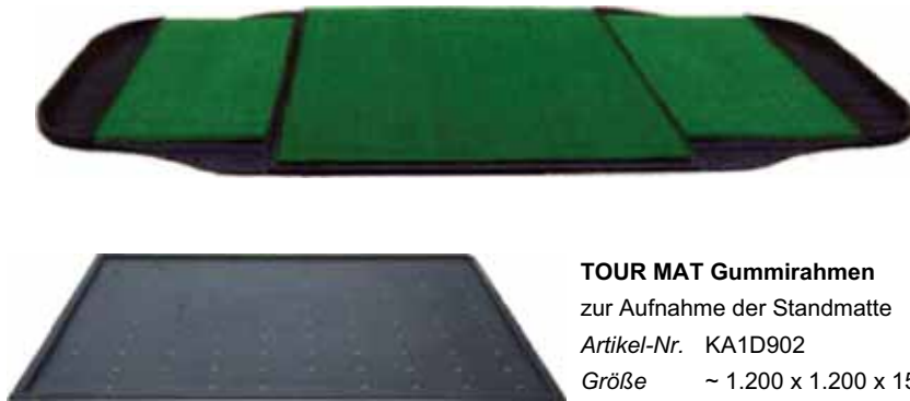
TOUR MAT Gummirahmen zur Aufnahme der Standmatte